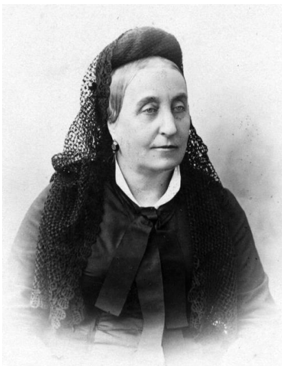
Giuseppina Strepponi, ultimul portret (1897).

Dar încet-încet, lucrurile și-au reluat cursul firesc. Verdi – zis și „ursul”, „pustnicul”, „faraonul”, „magul”, „banditul” (amicii erau foarte inventivi în materie de porecle drăgălașe) – își vedea liniștit de treburile fermei. Când dădea ninsoarea, se refugia în câte un oraș (Genova, ulterior Milano) căci Peppina nu suporta izolarea înzăpezită de la țară. În ceea ce-l privea pe el, ar fi rămas bucuros acolo, pe orice vreme și în orice anotimp, dar nu avea încotro. La Milano se ocupa de construirea unei case de odihnă pentru muzicienii bătrâni și, din când în când, consimțea să-și amintească de