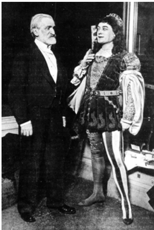
Giuseppe Verdi și Victor Maurel, primul interpret al lui Iago (1887).

Tot ce am descris până acum ne arată parcursul uriaș realizat de Verdi de la tradiționala operă a ariilor, duetelor, corurilor etc. la cea a acțiunii continue, adică la drama muzicală teoretizată de Wagner în jurul anilor '50, în timpul exilului său elvețian. Verdi nu